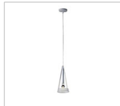
Fucsia 1 design by Achille Castiglioni