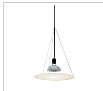
Frisbi design by Achille Castiglioni

Lampada a sospensione a luce diretta, diffusa e riflessa