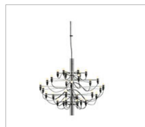
2097/50 design by Gino Sarfatti in 1958