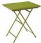
334 tavolo rettangolare pieghevole folding rectangular table

20 22 23 24 36 41 44 60 61 68 82 84 23 82 23 36 36 23 61 36