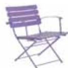
401 poltrona lounge pieghevole folding lounge chair

20 22 23 24 36 41 44 60 61 68 82 84 23 82 23 36 36 23 61 36