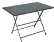
331 tavolo rettangolare pieghevole folding rectangular table

20 22 23 24 36 41 44 60 61 68 82 84 23 82 23 36 36 23 61 36